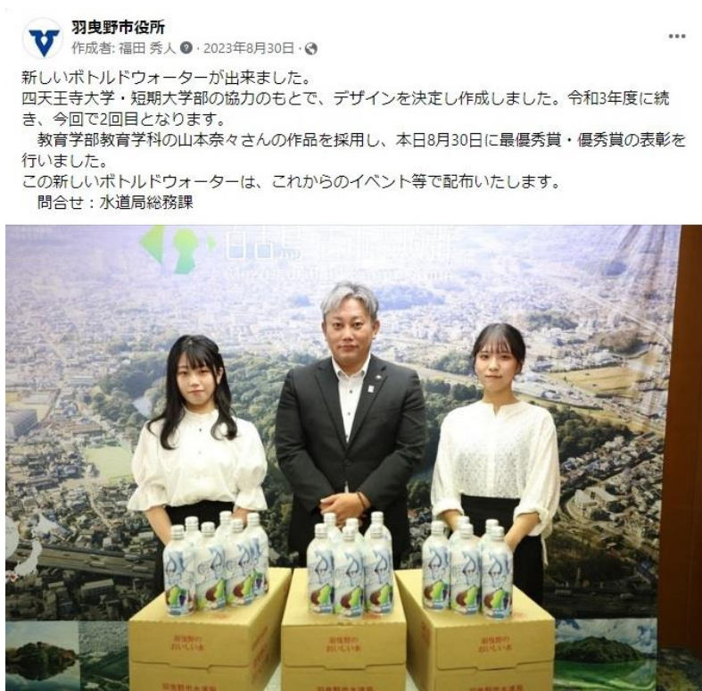
(令和4年度作成ボトルドウォーター)