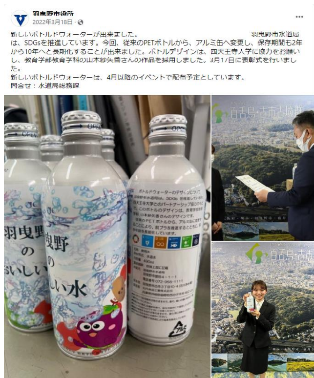
(令和3年度作成ボトルドウォーター)