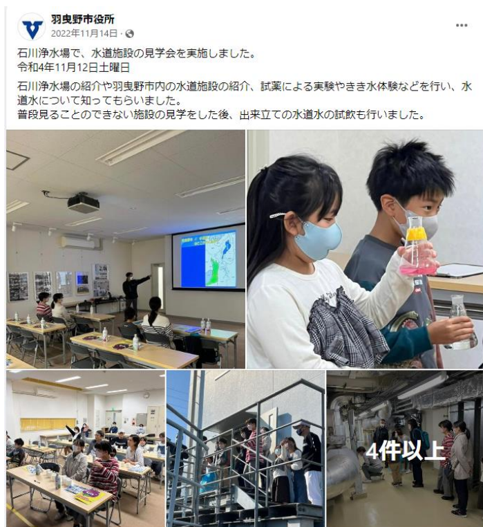
(石川浄水場見学会)