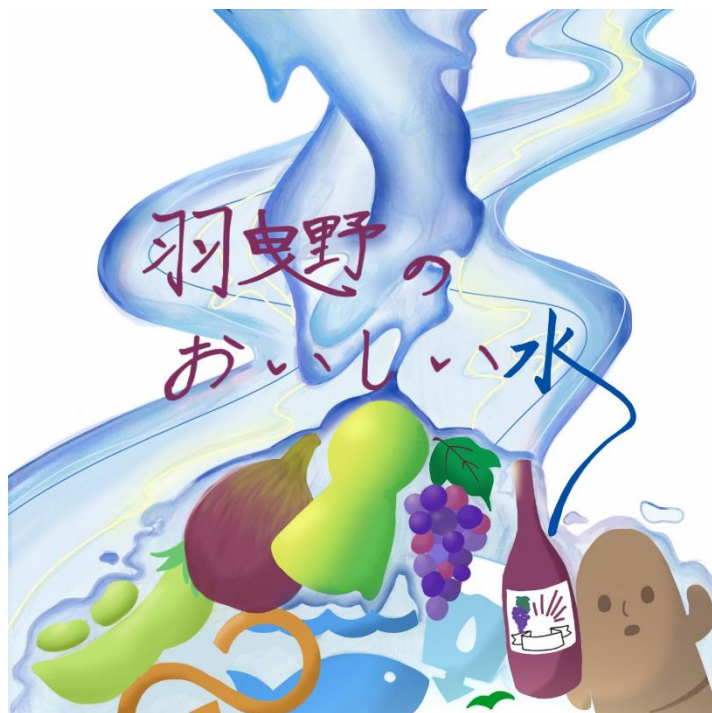
(令和4年度ボトルドウォーターデザイン)